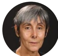
Mme Jégousse Comptabilité