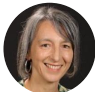
Mme Tabard Accueil